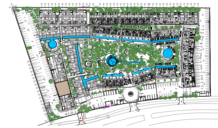
03 PLANTA DE CONJUNTO- PLANTA BAJA GROUND FLOOR FLOOR PLAN