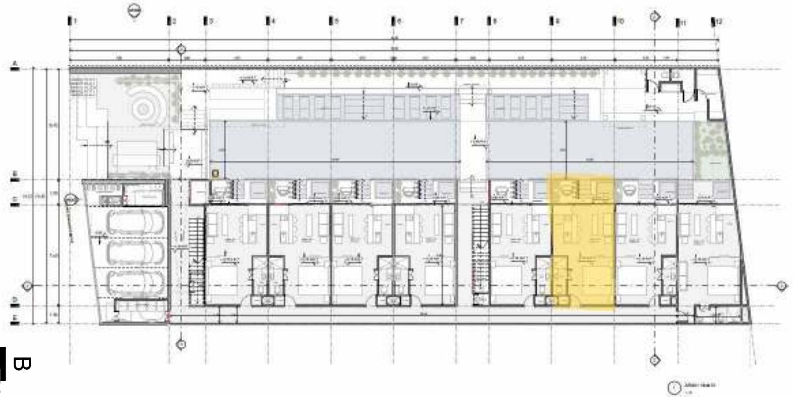
Plano de Ubicación